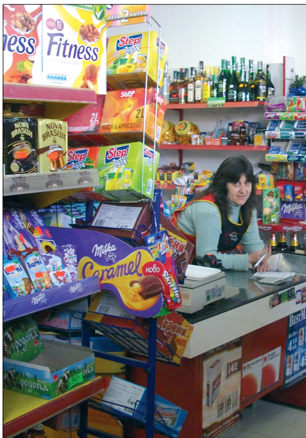
Основна стопанска дейност на кооперацията е търговията на дребно

та в малките населени места, водещи до намаляване на населението, кооперативните магазини са предпочитани сред местните жители. Богатият асортимент от стоки с добро качество и на достъпни цени се оценява от потребителите на двете населени места и магазините се радват на висока посещаемост.